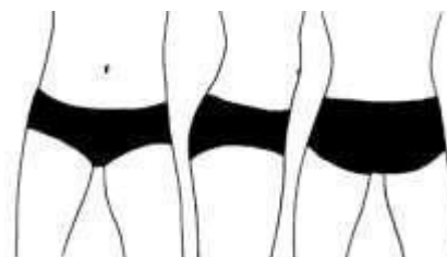
Минимальное покрытие для женских шортиков